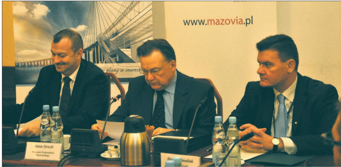
Podpisanie umowy na realizację inicjatywy JEREMIE

Mechanizm finansowy JEREMIE polega na przekazaniu przez Zarząd Województwa Mazowieckiego części środków z RPO WM do Funduszu Powierniczego, a następnie udostępnienie finansowania z tego źródła Pośrednikom Finansowym, którzy będą udzielać firmom m.in.: niskooprocentowanych pożyczek, kredytów, poręczeń itp. na atrakcyjnych warunkach. Wsparcie skierowane jest przede wszystkim do tych firm, których instytucje komercyjne nie są w stanie finansować, lub