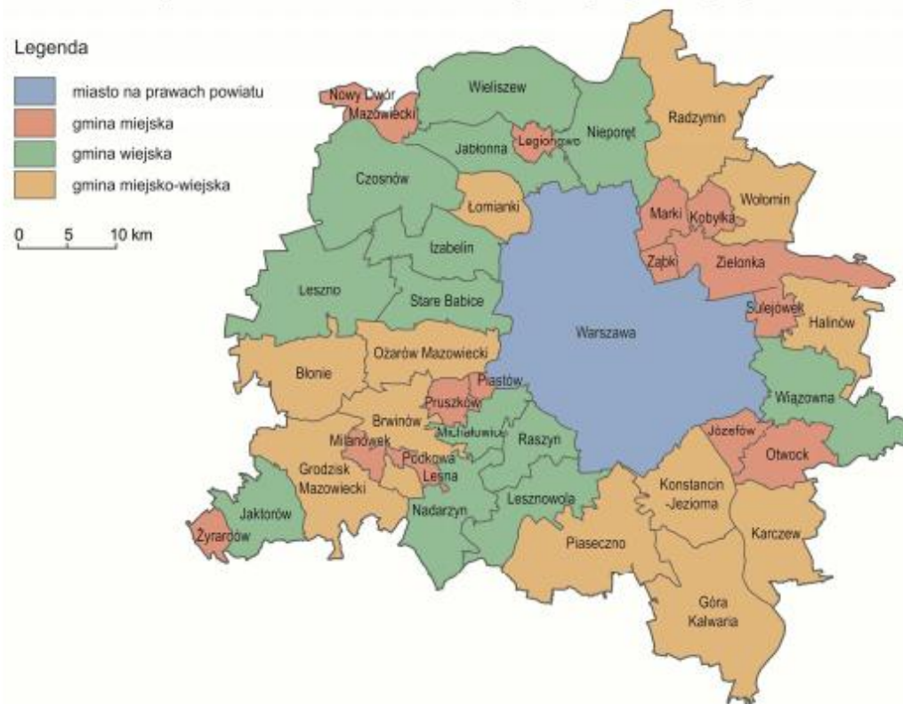
Mapa 1. Warszawski Obszar Funkcjonalny wg rodzaju gmin 4